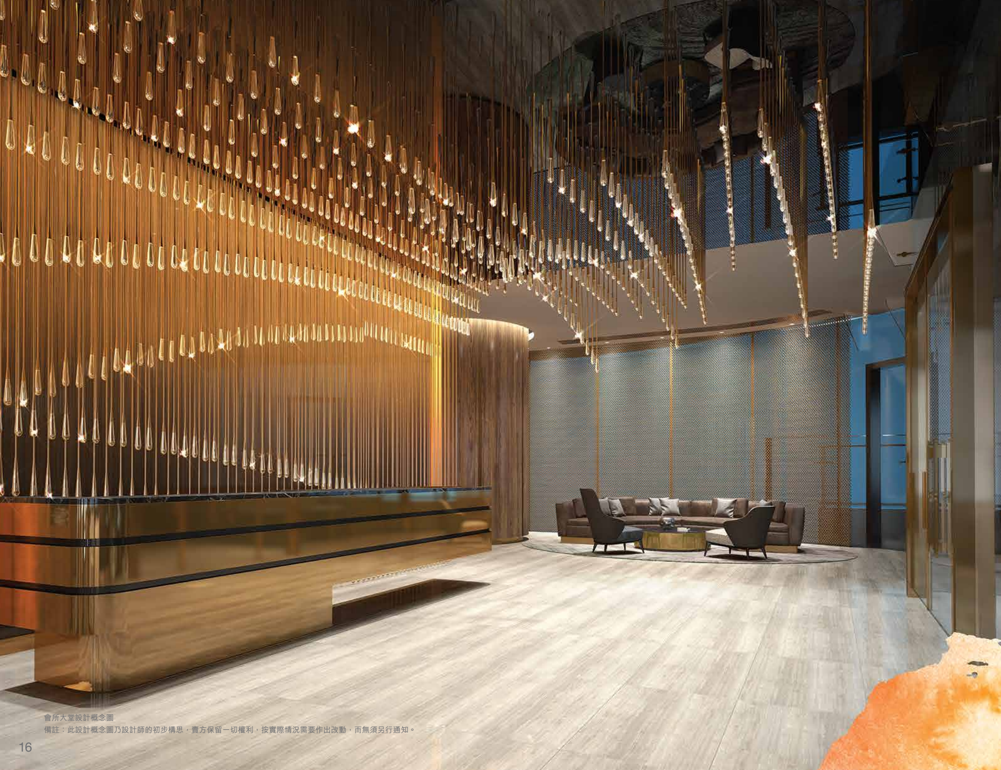
會所大堂設計概念圖

備註：此設計概念圖乃設計師的初步構思，貴方保留一切權利，按實際情況需要作出改動，而無須另行通知。