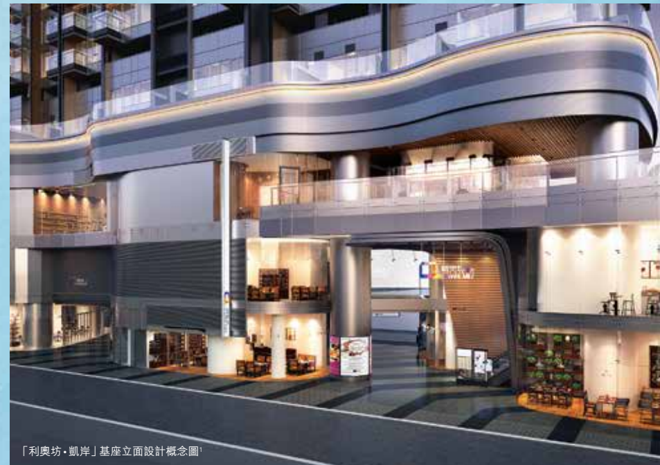
「利奧坊·凱岸」基座立面設計概念圖 1